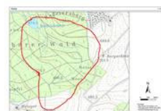
Ausschnitt topografische Karte (das hydrologische Einzugsgebiet ist rot umrandet)