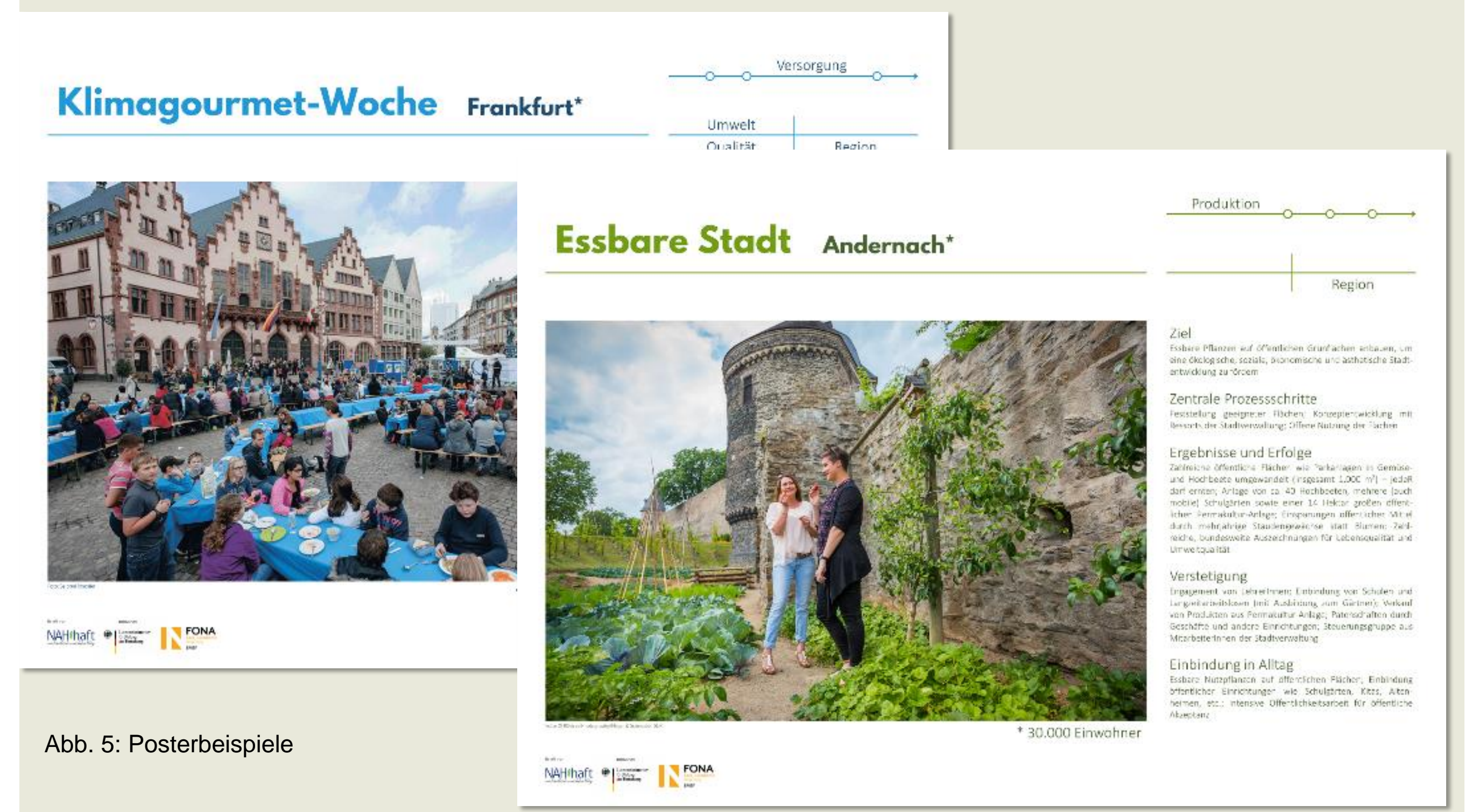
Abb. 5: Posterbeispiele

Für die Expertentreffen entwarf NAHhaft jeweils zehn Poster, die kommunale Vorbildprojekte zu nachhaltigen Ernährungssystemen porträtieren. Dazu zählen unter anderem: die "Essbare Stadt" Andernach, das Klimagourmet-Festival in Frankfurt, die Aktion "Fair ge-kocht" in Speyer, das Programm „Lebensmittel retten“ aus Swadlincote, die umfassende kommunale Ernährungsstrategie der Stadt Plymouth (England) sowie eine Auszeichnung für die besten Ernährungsprojekte in Brighton and Hove (England).