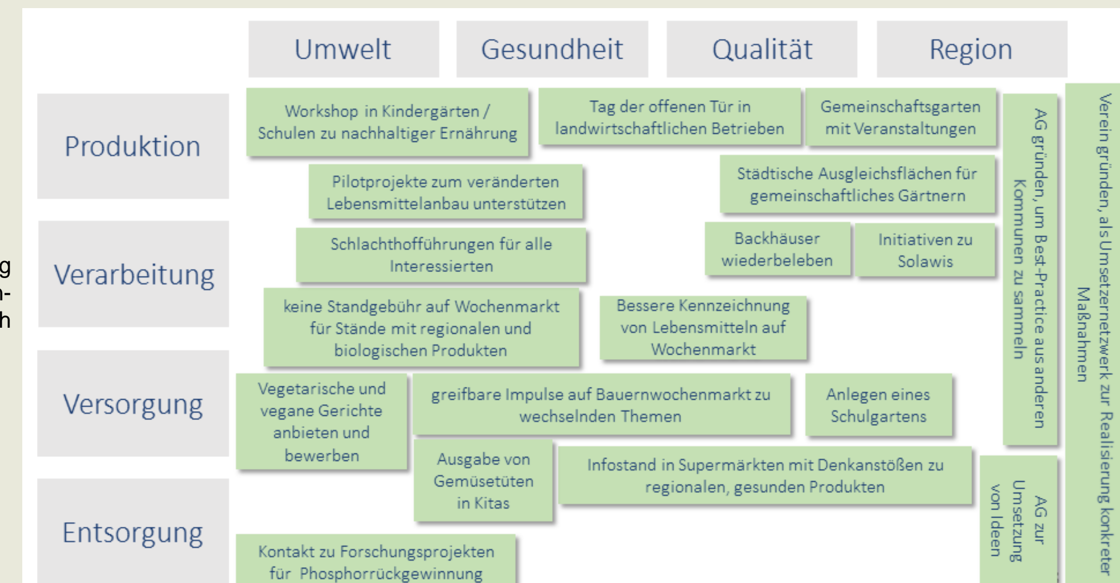
Abb. 2: Auswertung der Maßnahmenideen für Leutkirch

Die intensiven und gehaltvollen Diskussionen führten in beiden Städten zu substantiellen Ergebnissen, wie die folgende Abbildung beispielhaft darstellt. Die Ergebnisse sind für die Auswahl von Maßnahmen in den Kommunen von großer Bedeutung.