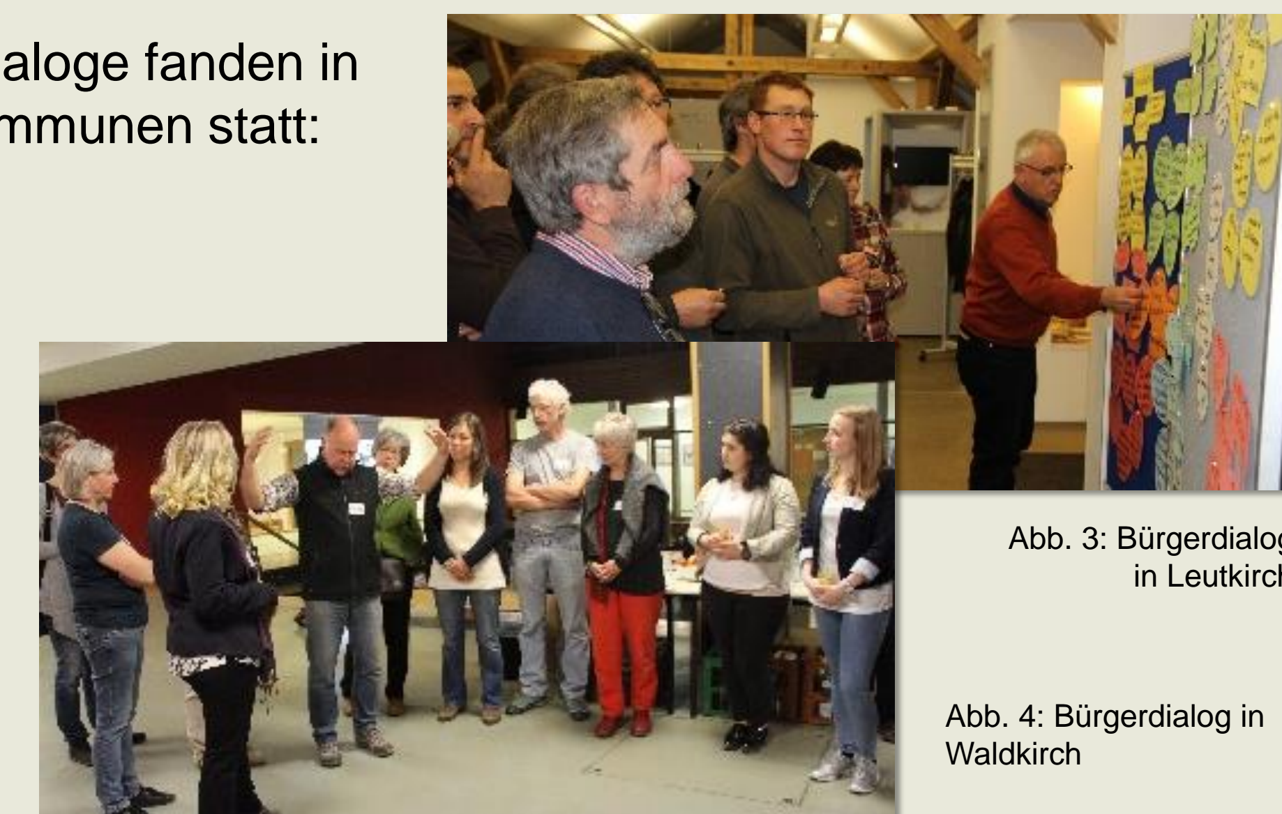
Abb. 3: Bürgerdialog in Leutkirch